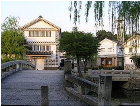
(左写真・倉敷美観地区中橋と考古館)