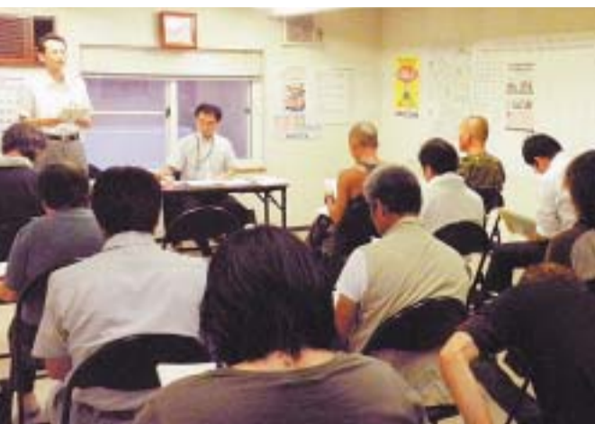
市の担当者を迎えて行った住宅リフォーム条例学習会

北海道北見市で「住宅改修等促進助成条例」(住宅リフォーム条例)が制定され、6月28日からスタートしました。北見民商や左官事業共同組合などの業界団体が共同で要望していたもので、市民と建設関係者あわせて市内建築業者に喜ばれています。実施期間は3月31日まで、増改築に加え、修繕・模様替え土台、塗装、建具の取替えなどなどの工事が対象となっています。実施に先駆け、市が6月24日に行った説明会には200人以上の建築業界関係者が参加。制度の開始を待って一部の業者で工事が遅れていた状況もあり、期待の高さをつかがわれました。