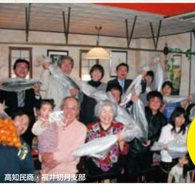
高知民商・福井初月支部

民商・全商連は創立から60年。全国に約600の民主商工会(民商)があり、地域ごとに支部や班をつくって活動しています。