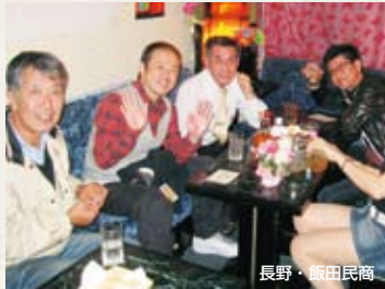
夜の街スタンプラリーで飲食店を激励

東日本大震災に対応し、ほとんどの業種が対象となるセーフティネット保証や金融円滑化法も活用し、金利引き下げや、借り換えなど多くの成果をあげています。