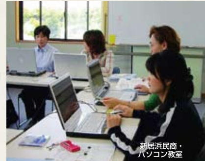
新居浜民商・パソコン教室

「確定申告が不安」「青色申告特別控除65万円を取りたい」「法人の記帳・決算を自分でやってみたい」などの相談にこたえ、パソコン講座などを開催しています。